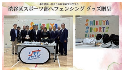
渋谷区小学校へフェンシング道具一式