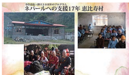
奉仕活動 ネパール恵比寿村 17年の支援