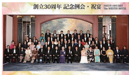
創立30周年 メンバー全員記念写真