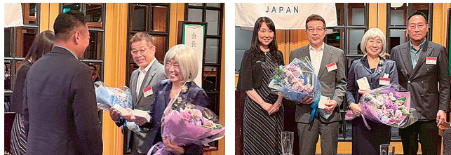
新会長・幹事より徳江会長・横町幹事へ花束の贈呈。1年間お疲れさまでした。