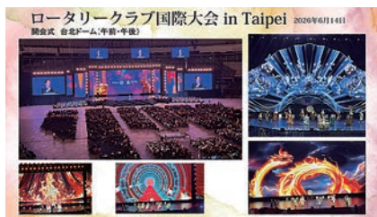
国際大会in台北 開会式