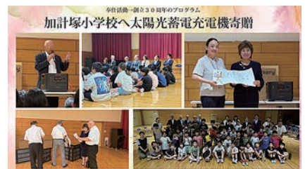
加計塚小へ太陽光充電器