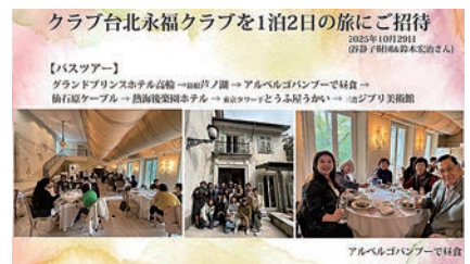
姉妹クラブとバスツアーチーム