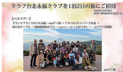
姉妹クラブとバスツアーチーム