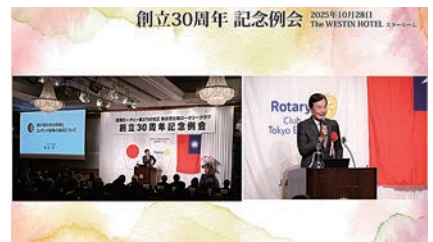
記念例会 都倉文化庁長官 「我が国の文化政策とコンテンツ産業の振興」