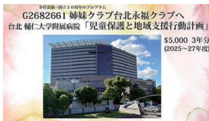
G.G.姉妹クラブへのサポート3年分