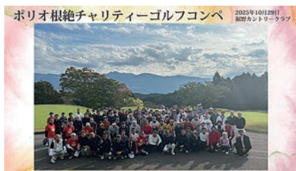
式典・祝宴翌日 ゴルフチーム