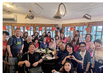
台北永福RCの皆さんと九份観光