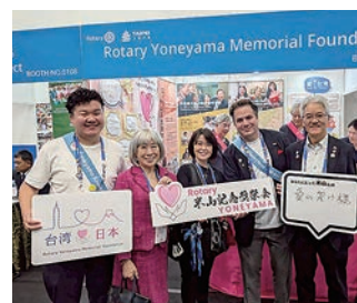
友愛の家に「米山学友会ブース」