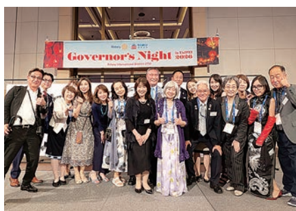
台北ロータリー国際大会 ガバナーナイト