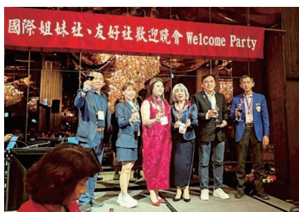
姉妹クラブ歓迎ナイト