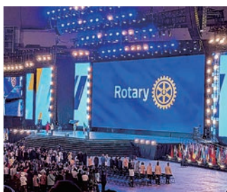
開会式 ロータリー旗入場