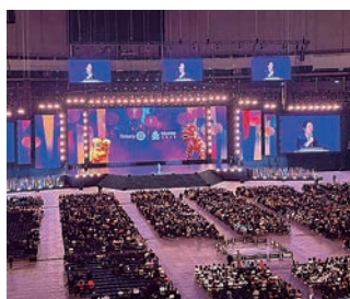
開会式 満員の台北ドーム