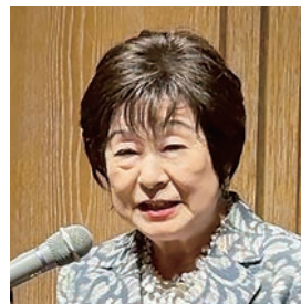
元参議院議員 第32代参議院議長